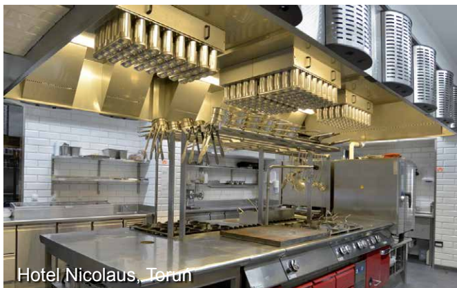
Hotel Nicolaus, Terun

W 15 latach działalności firma dostarczyła różnego typu okapy Jeven do ponad 2 000 obiektów na terenie całej Polski. Oto kilka przykładów: