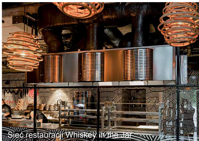
Sieć restauracji Whiskey in the Jar