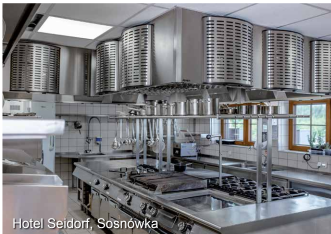
Hotel Seidorf, Sosnowka