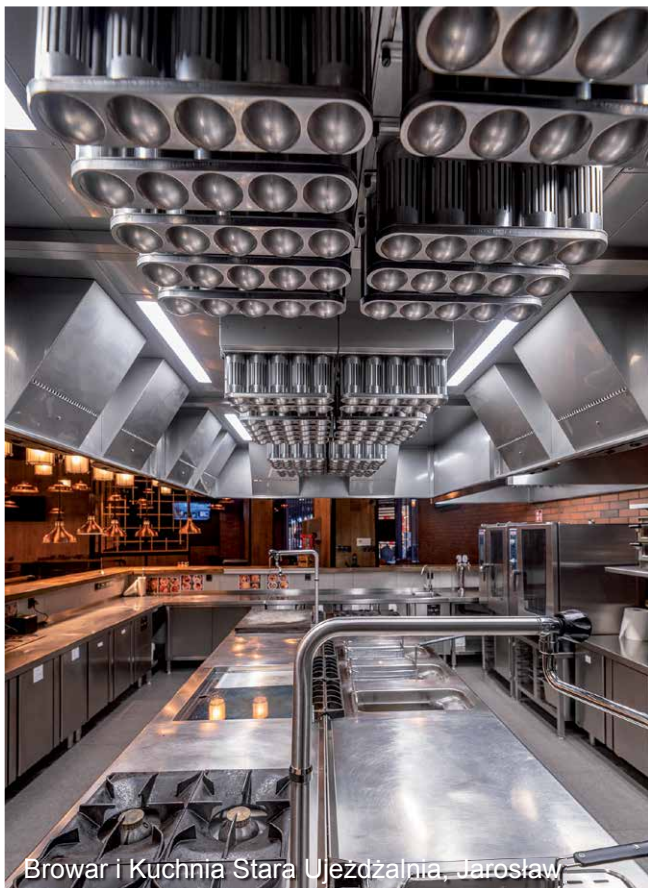
Browar i Kuchnia Stara Ujeźdźalnia, Jarosław