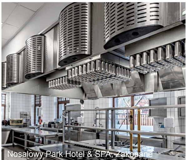
Nosalowy Park Hotel & SPA, Zakopane