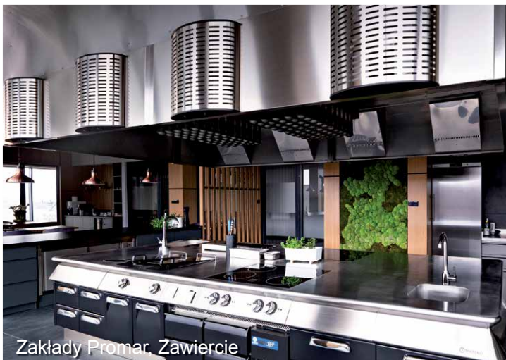
Zakłady Promar, Zawiercie