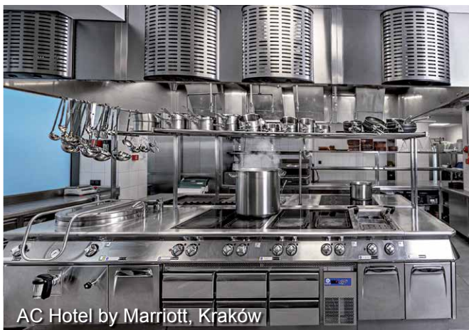
AC Hotel by Marriott, Kraków

W 15 latach działalności firma dostarczyła różnego typu okapy Jeven do ponad 2 000 obiektów na terenie całej Polski. Oto kilka przykładów: