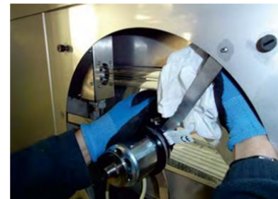
Czyszczenie silnika i komory wywiewnej filtra

- płyty wewnętrzne okapu należy przetrzeć od środka raz lub dwa razy w roku, zgodnie z wymogami higieny.