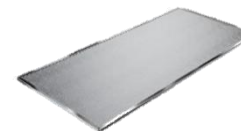
Filtr siatkowy FF